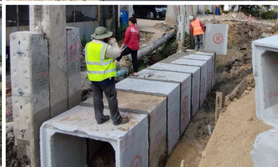
งานต่อเหลี่ยมคอนกรีตเสริมเหล็กขนาด 1 - 1.20 x 1.20 เมตร กม.ที่ 2+171 - กม.ที่ 2+201 LT และกม.ที่ 1+949 - กม.ที่ 1+995 RT

หากท่านผู้อ่านได้มีโอกาสสัญจรผ่านพื้นที่ก่อสร้าง และพบเห็นงานก่อสร้างดังกล่าว ขอให้ร่วมกันจับชื้อยานพาหนะอย่างระมัดระวัง และโครงการฯ ขอภัยในความไม่สะดวกมา ณ ที่นี้ด้วย